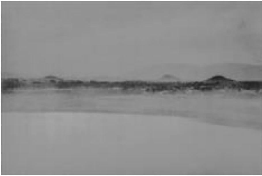
大正初期の大和三山