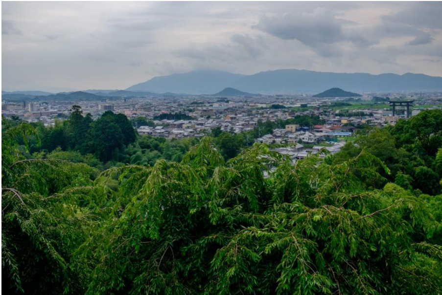
平成 28 年大美和の杜から見た大和三山