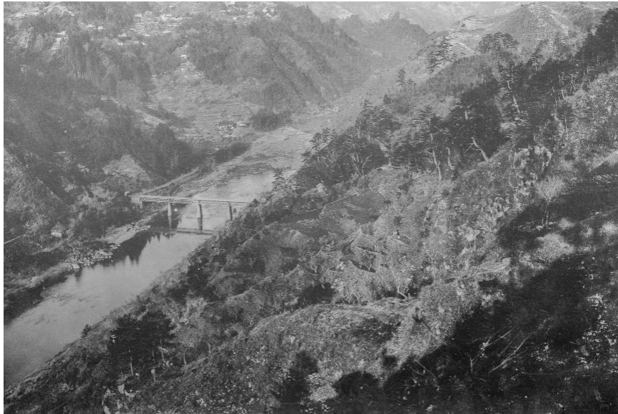
初代月ヶ瀬橋（明治 40 年頃） 尾山天神森方面から奥に桃香野の集落。