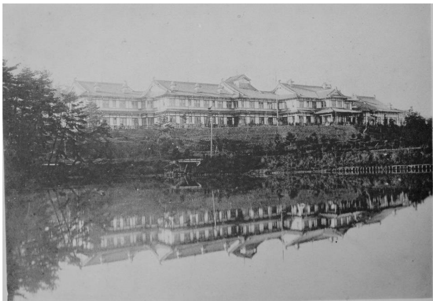
大正初期の奈良ホテル 奈良名勝写真帖