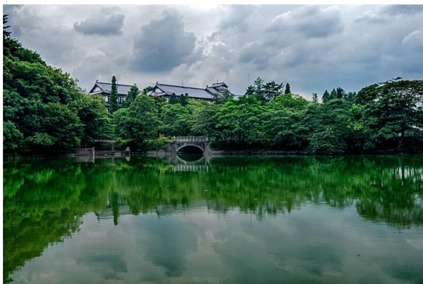
現在の奈良ホテル