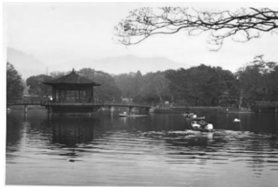
昭和 40 年の鷺池と浮見堂