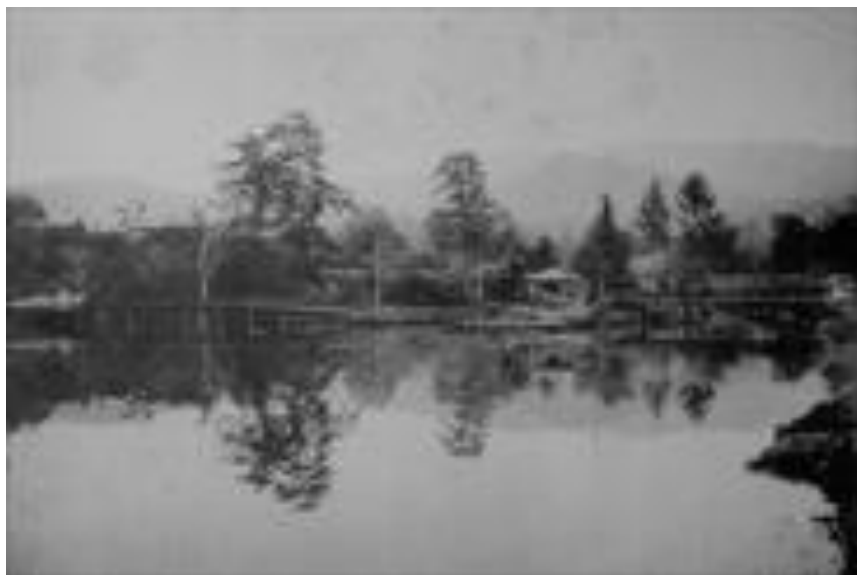
大正初期の鷺池付近