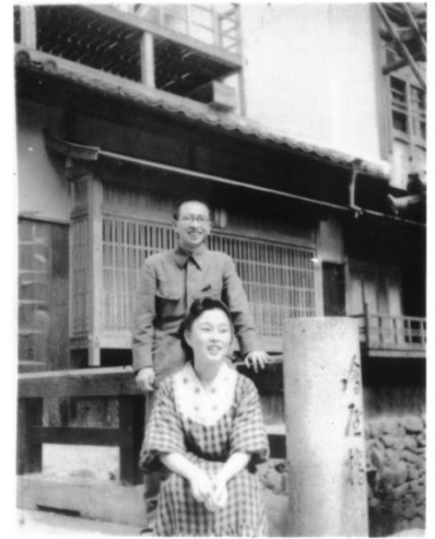
戦後の絵屋橋 木の欄干（金属供出） 写真⑤