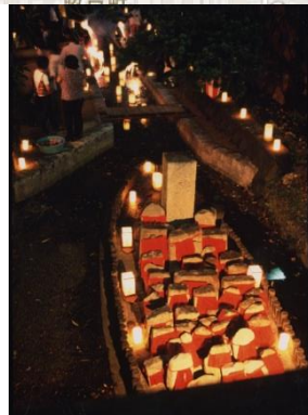
燈籠流し 嶋嘉橋下の舟形地蔵 写真⑥