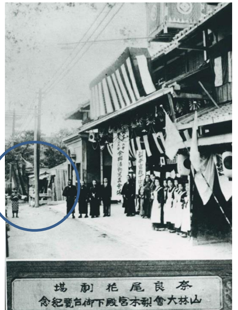
大正時代 尾花劇場の横に尾花谷川が流れている。写真⑦