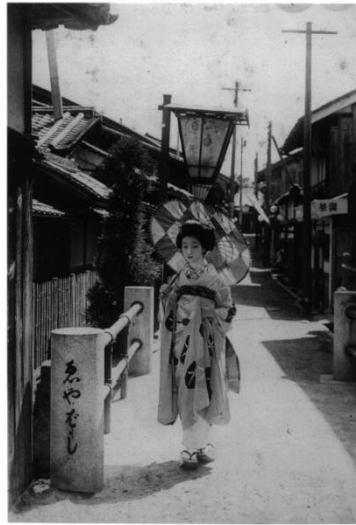
昭和 7 年 半玉 絵屋橋にて 写真④