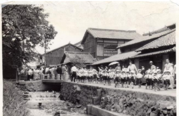
昭和 28 年頃 伝香寺前より率川と伝香寺橋 写真③