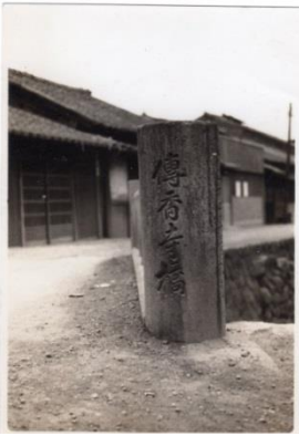
昭和 35 年頃 伝香寺橋 写真①