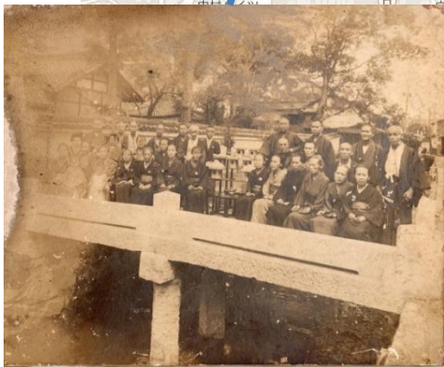
大正 10 年代 伝香寺表門の率川にかかる石橋 老人会の皆様 写真②