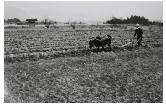
昭和 32 年 4 月上旬 宮跡は未だ国 史跡でなく田んぼを耕している。