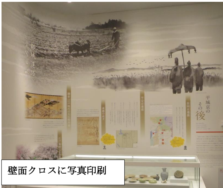
壁面クロスに写真印刷

平城宮いざない館は、平城宮跡歴史公園の意義とすばらしさを伝え、往時の面影を残す平城宮へと、あなたをいざなうガイドンス施設です。展示室 4「時をこえて」にて写真と映像展示がされている。平城宮の発掘から保存までの歴史を解説。