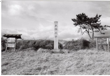
昭和 38 年 大極殿跡碑