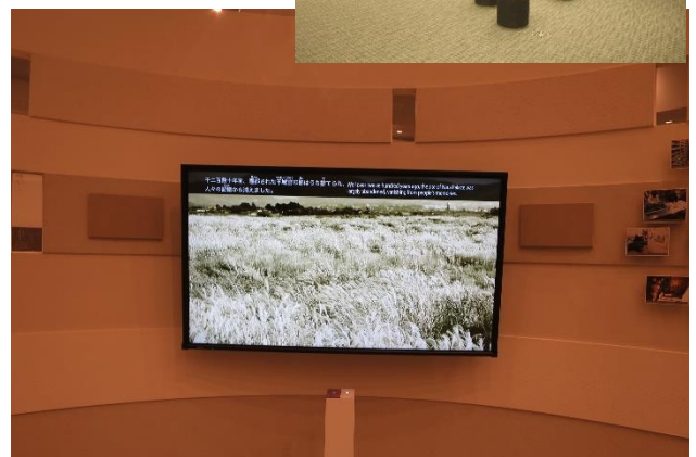
平城宮跡は千二百年打ち捨てられていた