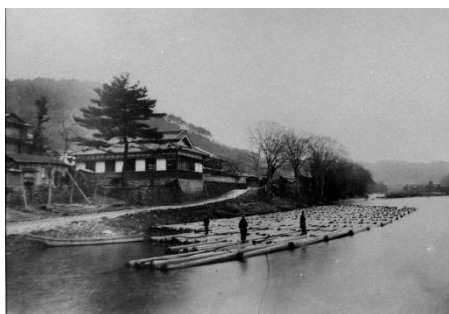
竹林院 昭和初期 ふるさと吉野懐古写真集

木材市場で昔の筏流しの話が出て紹介された絵葉書 昭和初期までは吉野川に筏を組んで木材を運んだ