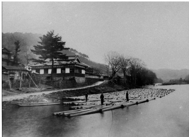
筏流し 飯貝検査所 筏の上で市が開かれ、市後筏を組み替えて運ぶ