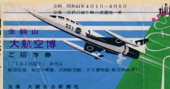
10 生駒山大航空博 招待券