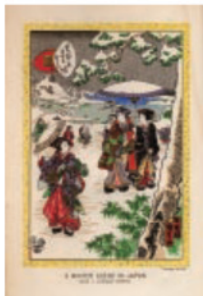
Narrative of the Earl of Elgin's Mission to China and Japan in the Years 1857, '58, '59 エルギン卿使節録 Oliphant, Laurence ローレンス・オリファント 1860年

また、期間中、今回の企画展開催の実現を記念し、OAG会長による記念講演会も開催します。