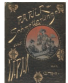
Papierschmetterlinge aus Japan 浮かれの蝶 Netto, Curt クルト・ネット 1888年