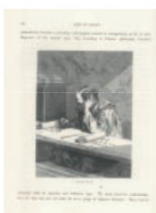
Japan and the Japanese Illustrated 図説 日本と日本人 Humbert, Aimé エメ・アンベール 1874年