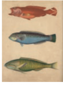
Narrative of the expedition of an American squadron to the China Seas and Japan ペリー提督艦隊日本遠征記 Hawks, Francis L. フランシス・L・ホークス 1856年