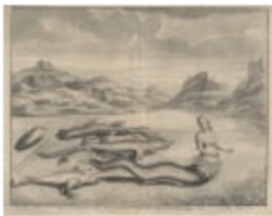
Omstanding Verhaal van de Geschiednisse アンボンにおける神事とその歴史に関する詳細な記述 Valentyn, François フランソワ・ヴァレンティン 1726年