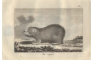
Voyages de C.P. Thunberg, auf Japon II ツンベリーの日本紀行 第二巻 Langles, L., Lamarck, J.B. L・ラングレ、J・B・ラマルク 1796年