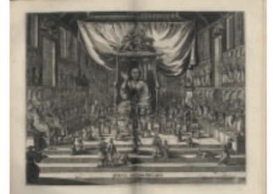
Gedenkwaardige Gesantschappen der Oost-Indische Maetschappy 東インド会社遣日使節紀行 Montanus, Arnoldus アーノルドゥス・モンタヌス 1669年