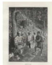
In Lotus-Land Japan この世の楽園 Ponting, Herbert G ハーバート・G・ボンティング 1910年