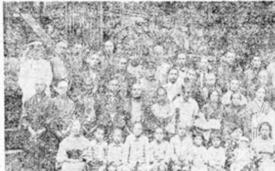
渡津軍人會. Caption for the group photograph.

畫飯. Text or notice related to 'Meal Drawing' (畫飯).