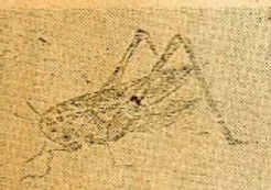
栗生 津生 三郎 伯の